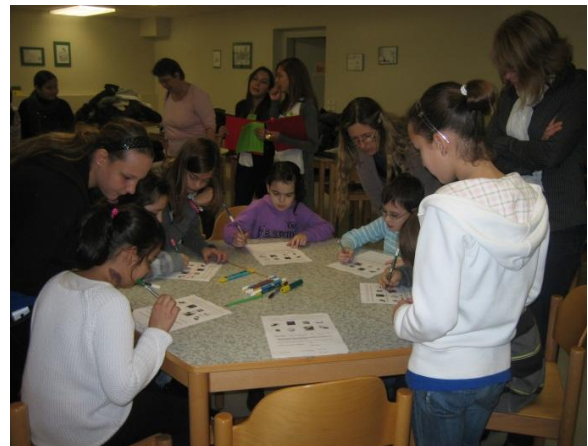
Englischkenntnisse werden vertieft