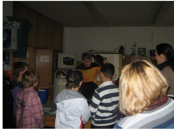
Versuche im Physiksaal