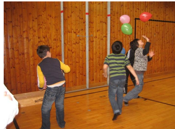
Aktiv im Turnsaal