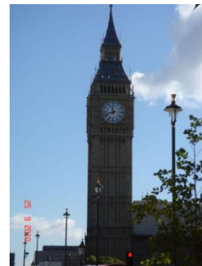
Big Ben – Houses of Parliament