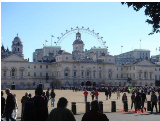
London, Horseguards Parade

An 4 Tagen erhielten die Kinder vormittags Sprachunterricht im ELC-English Language Center-laut Aussage der Kinder profitierten sie auch sicht- und hörbar davon.